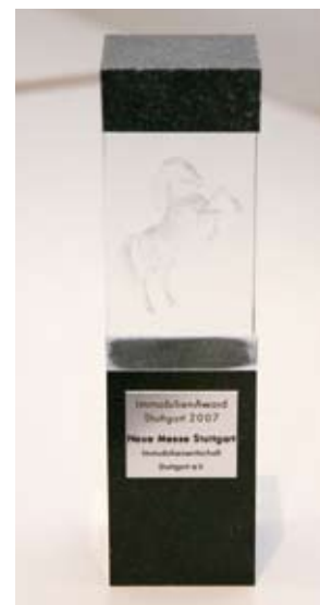
Das Rössle ist auch das Wappen des IWS

Für den Immobilien-Award konnten sowohl öffentliche wie private Bauten eingereicht werden, Büro- und Einzelhandelsobjekte, Spezial- und Infrastrukturimmobilien sowie stadtprägende Wohnbauten. Bewerbungen